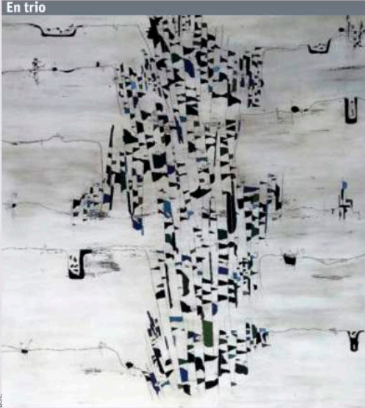
Manu Tintore, "Costa Brava n°2", technique mixte sur papier marouflé sur panneau, 150 x 150 cm, 2017.