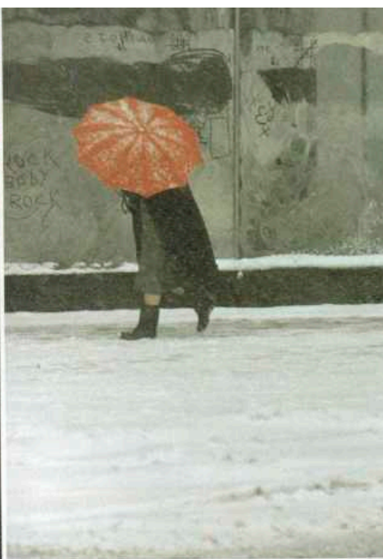
Saul Leiter, Hadden, 1960 Saul Leiter, Red Umbrella, ca. 1958