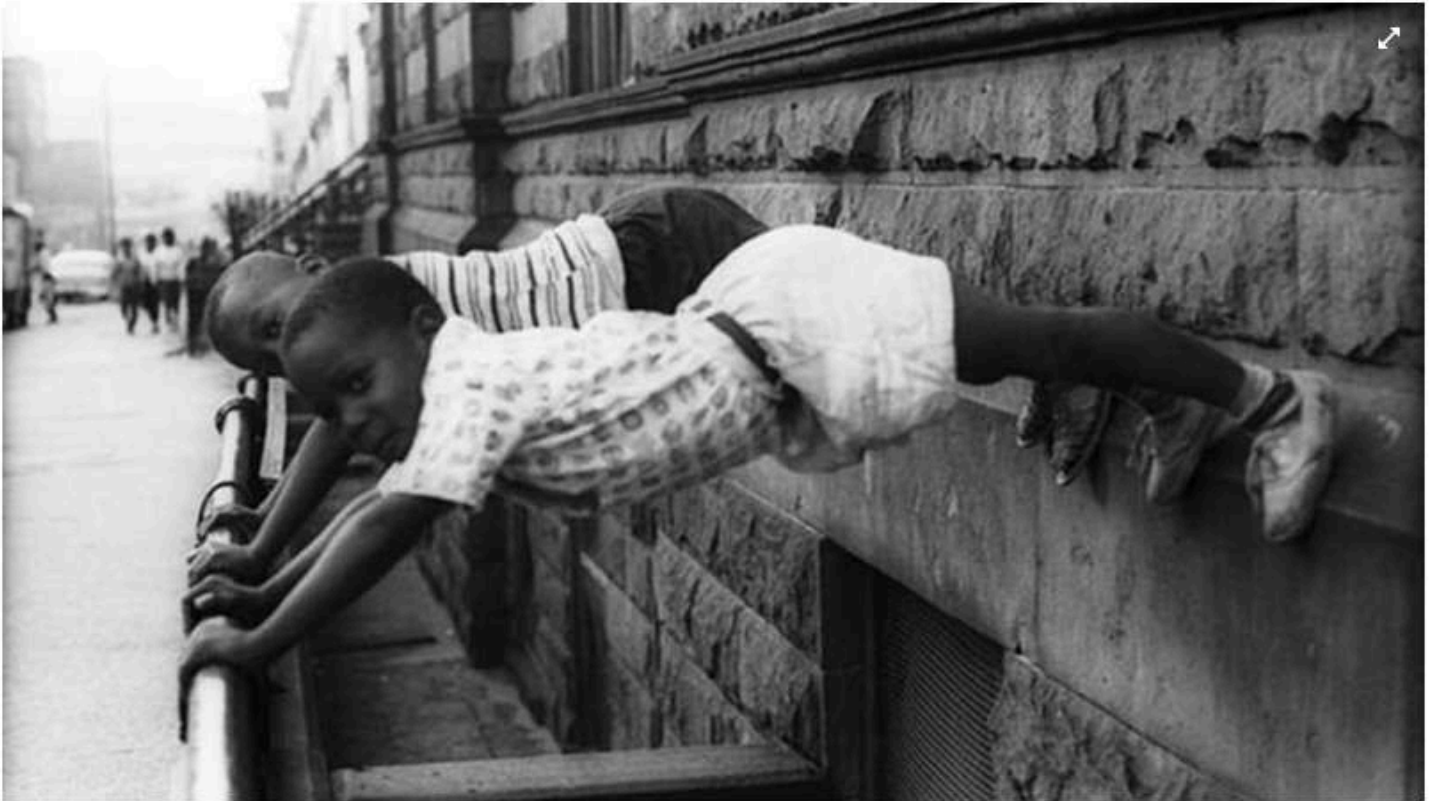
Straatfotografie, New York (1963) - © Yoors Courtesy Gallery Fifty One