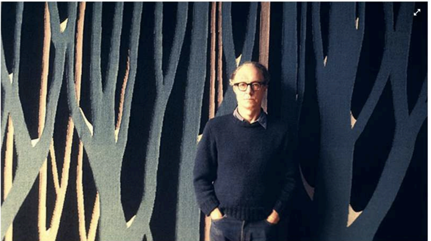
Jan Yoors voor één van zijn wandtapijten.

Jan Yoors zei ooit: "Wandtapijten moeten op groot formaat zijn, episch... Een klein formaat wandtapijt is een tafelmatje." Hij zag het leven idem dito. Zijn leven kon geen tafelmatje zijn.