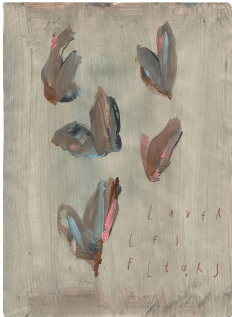
Arpaïs Du Bois, 'laver les fleurs', 2020, 25 x 19 cm, Courtesy Gallery FIFTY ONE.

Voor de presentatie wijkt Du Bois af van wat evident of normaal is. Ze toont haar werk op vrijstaande wanden in vrolijke tinten analoog aan de kleuren die ze in haar schilderijen toevoegde. De inrichting van de tentoonstelling versterkt de teneur van haar werk. In de benedenruimte van de galerie staan drie wanden die van laag naar hoog oplopen en zo een omgekeerd perspectief vormen. Het is bevreemdend, sluit aan bij de heersende sfeer en moedigt aan om anders te kijken. We kiezen zelf het parcours dat we volgen en in welke volgorde we de werken bezichtigen. Op de wanden hangen veel schilderijen in verschillende formaten dicht bij elkaar. De veelheid nodigt uit om de tijd te nemen, niet alleen om het te bekijken, maar ook om de betekenis te begrijpen.