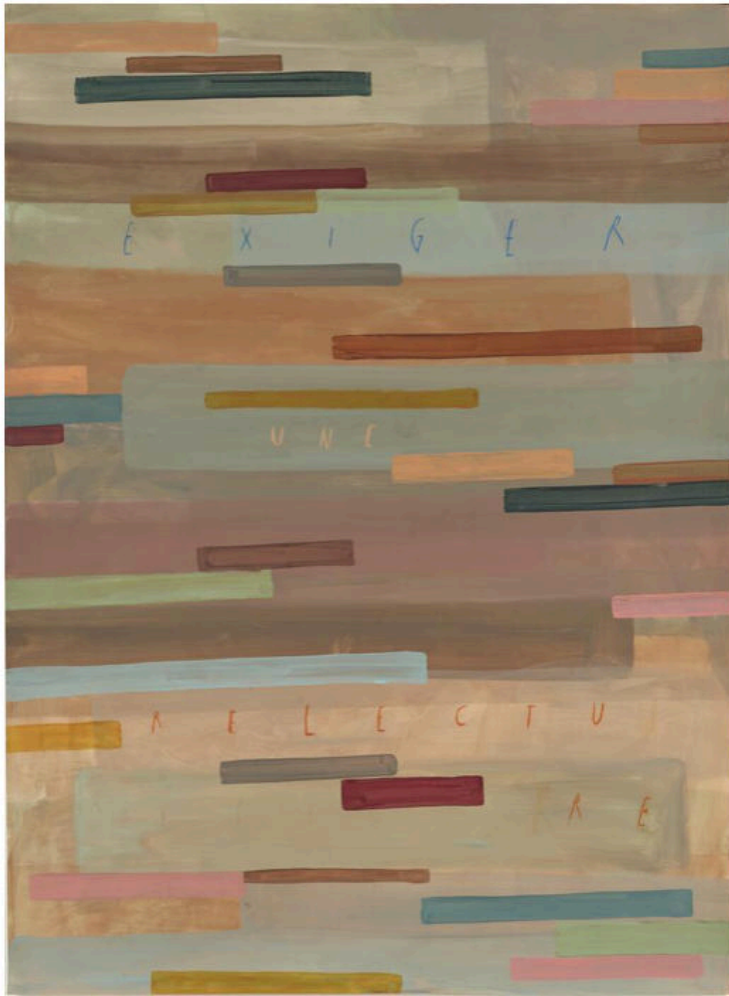
Arpaïs Du Bois, 'exiger une relecture', 2020, 150 x 110 cm, Courtesy Gallery FIFTY ONE.