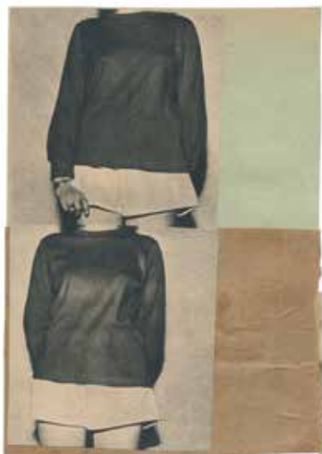
When I Was a Boy 39, 2016

Ze begon met een studie schilderen, maar wilde niet de academische weg opgaan. Tijdens een modestudie, die ze niet