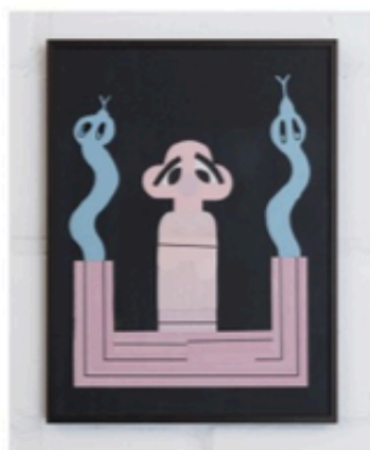
Te koop via Kunst aan Zet: Der Schlangebeschützer van Nel Aerts: 2.000 euro.