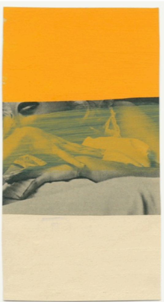
Te koop via Kunst aan Zet: Cheveux longs cheveux courts van Katrien de Blauwer: 1.258 euro. © Gallery Fifty One