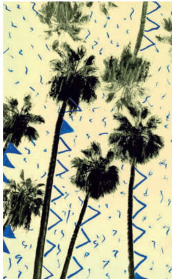
'Niet alles blijft interessant als je het eindeloos herhaalt', zegt Bruno V. Roels. 'De palmboom wel.' © BRUNO ROELS / IMAGES COURTESY OF GALLERY FIFTY ONE

'Het paradijs ligt om de hoek, maar we zullen het nooit bereiken. Ondertussen blijven we het proberen'