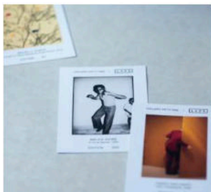
LINKS DE FOTO'S VAN BRUNO ROELS, HARRY GRUYAERT EN MALICK SIDIBÉ DIE WERDEN GEBRUIKT OP DE WIJZERPLAAT VAN DE DRIE LIMITED-EDITIONHORLOGES.