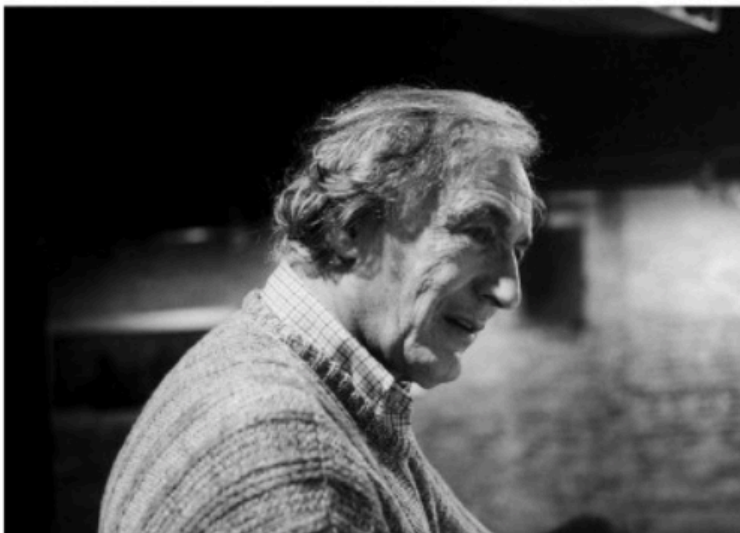
De vitaliteit en het enthousiasme in de blik van William Klein zijn niet te negeren (foto uit de jaren 90).