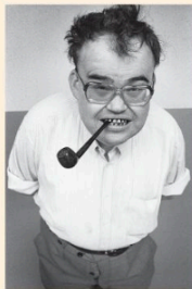
Alle geportretteerden staan voor een onopvallende achtergrond en kijken frontaal in de lens, vaak ernstig. Dan houden de gelijknissen op.