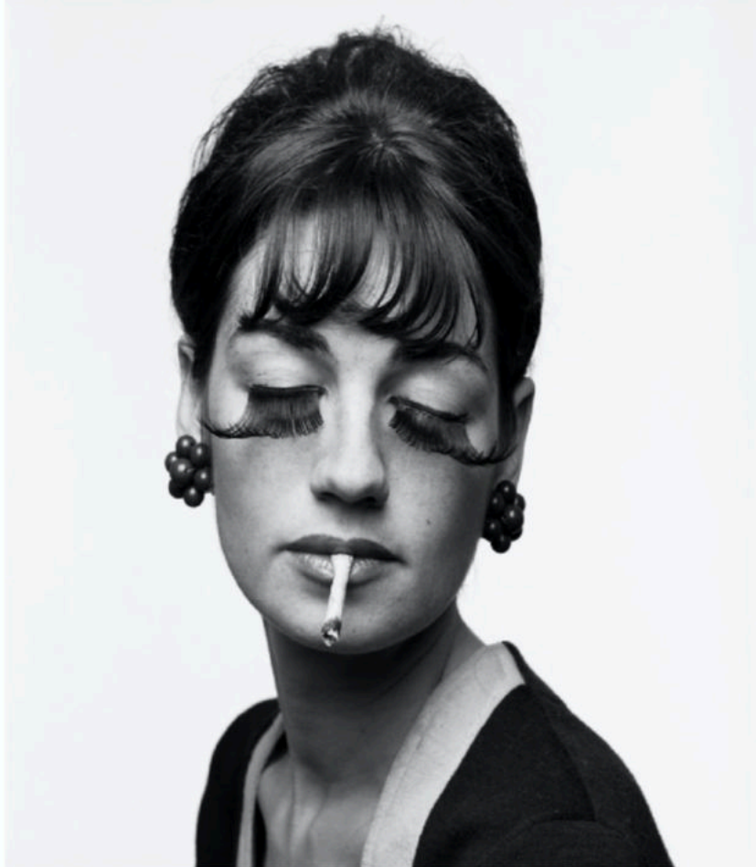
Studioportret, 1993. Jacques Sonck/Courtesy Gallery Fifty One

JACQUES SONCK – Portraits 1977-2019 — 25th January - 31st March 2024 at Fondation A Stichting 'De uitzondering is de regel' by Veerle Vanden Bosch on February 3rd 2024 in De Standaard, p. 38-41.