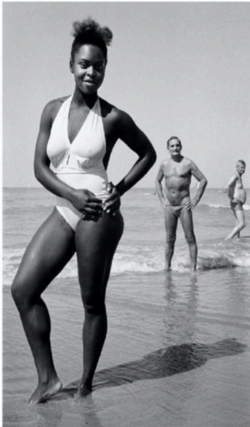
De Panne, 1987.