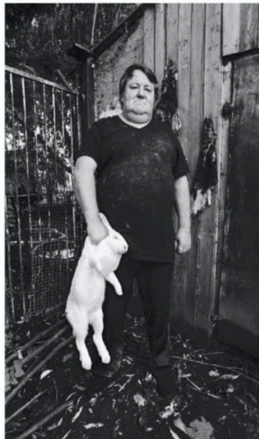
Maldegem, 2013.