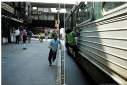
Harlem, New York, 1976.