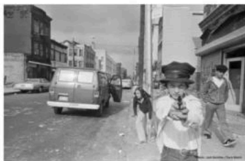
Bronx, New York, 1977.