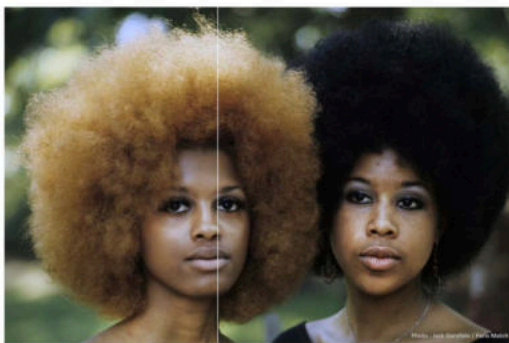
Harlem, New York, 1976.