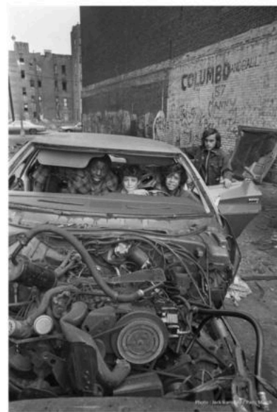
Bronx, New York, 1977.