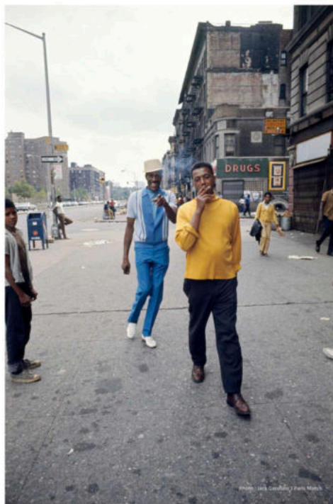
Harlem, New York, 1976.

JACK GAROFALO – Street Chronicles: Jack Garofalo — 24th February - 20th April 2024 at Gallery FIFTY ONE TOO 'Geen blanke mannen' on March 23th 2024 in De Standaard, p. 28-29.