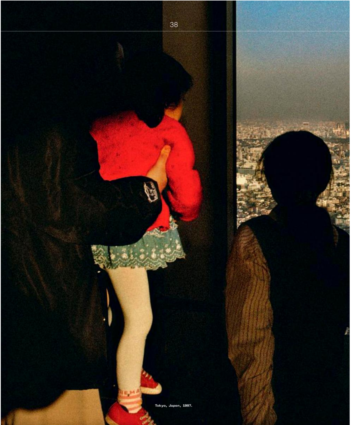
Tokyo, Japon, 1997.

Les gens des villes... Harry Gruyaert, p 38 -47