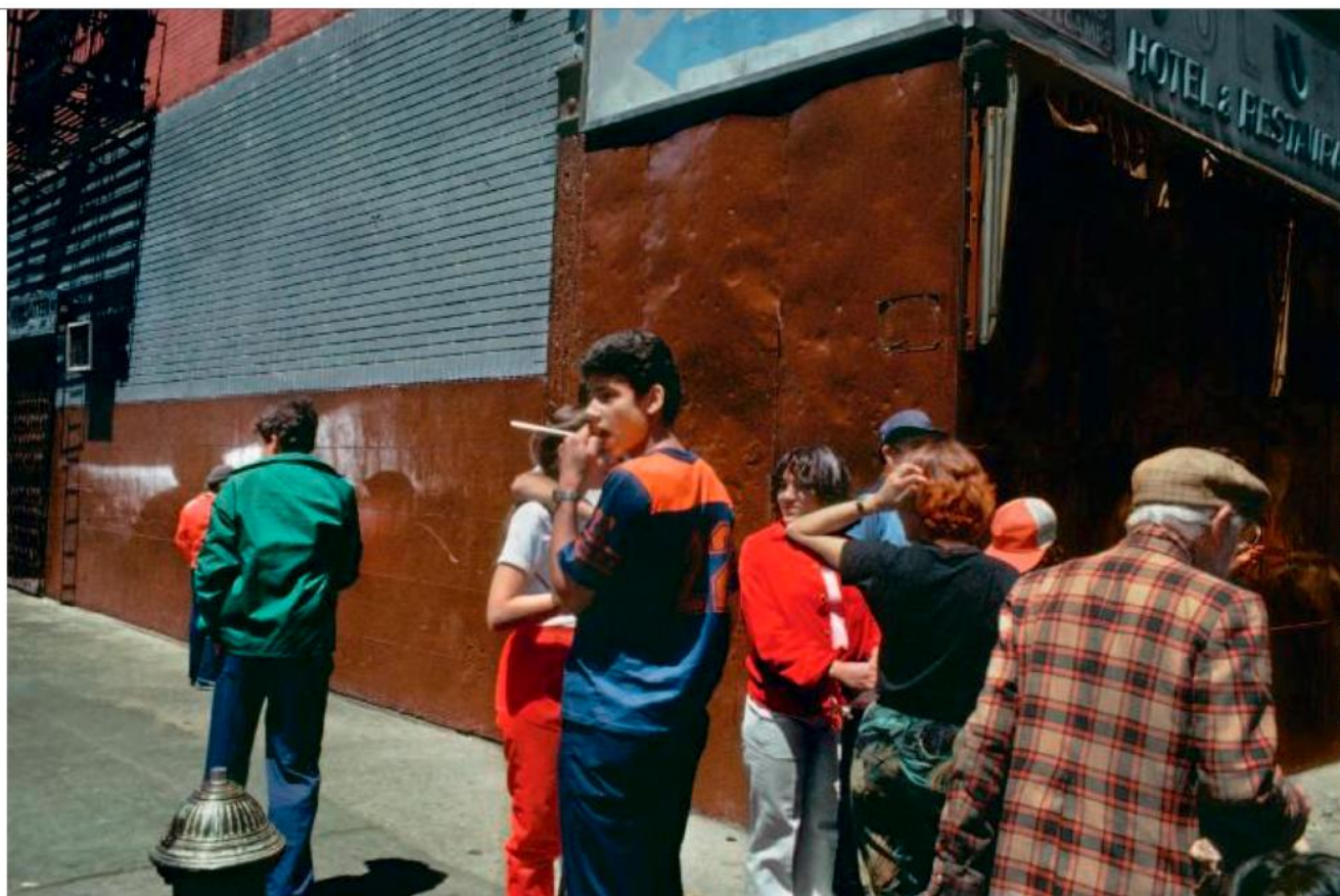
New York, États-Unis, 1978.