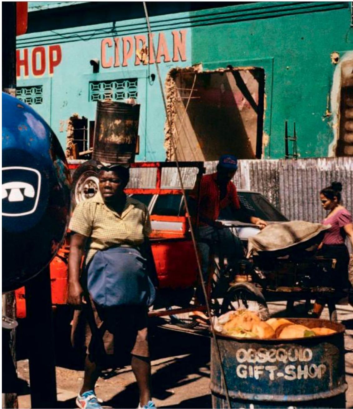
République dominicaine, 1991.