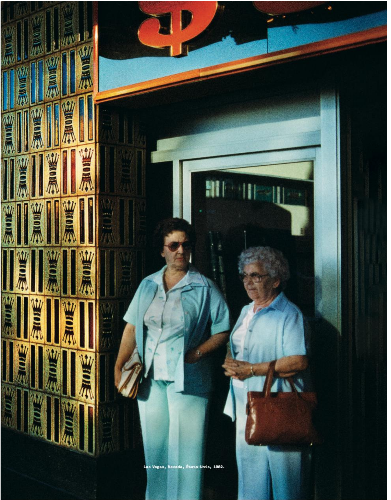
Las Vegas, Nevada, États-Unis, 1982.